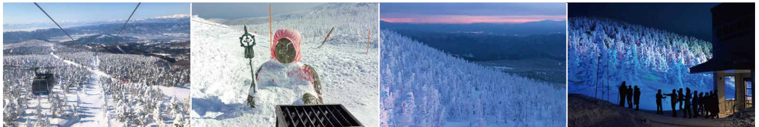
※写真はすべてイメージです。