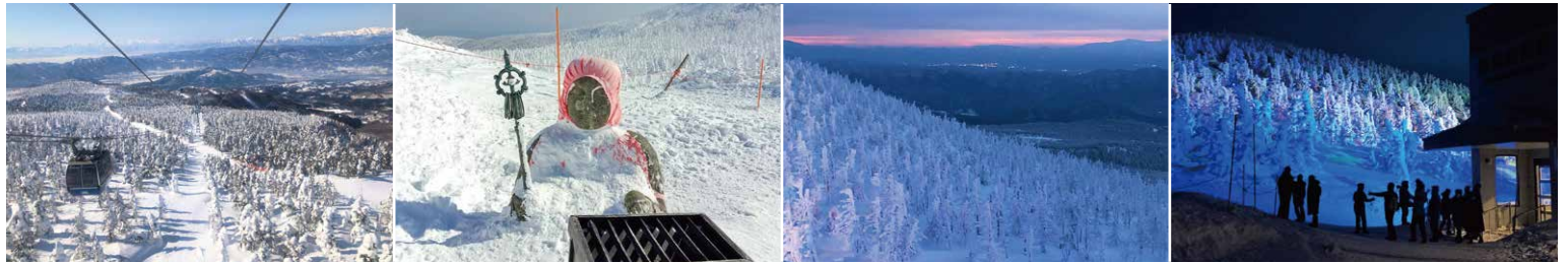
※写真はすべてイメージです。