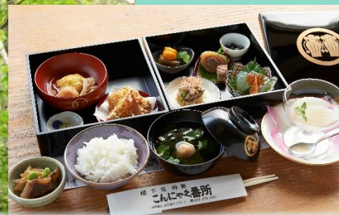
昼食は丹野こんにゃく番所の「クアオルトこんにゃく会席箱膳」。整腸作用等が期待されるこんにゃくを用いて、地域の食文化を盛り交ぜ、味付けや食感、見た目までこだわり抜いたここでしか味わえないメニューです。