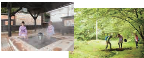
集合場所：上山城かかし茶屋 駅から徒歩10分