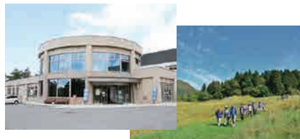
集合場所：ZAOたいらぐら 駅から車で約30分