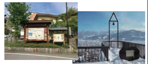
集合場所：葉山温泉入り口看板 駅から徒歩25分