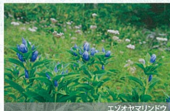
エゾオヤマリンドウ