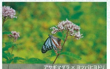
アサギマダラ × ヨツバヒヨドリ